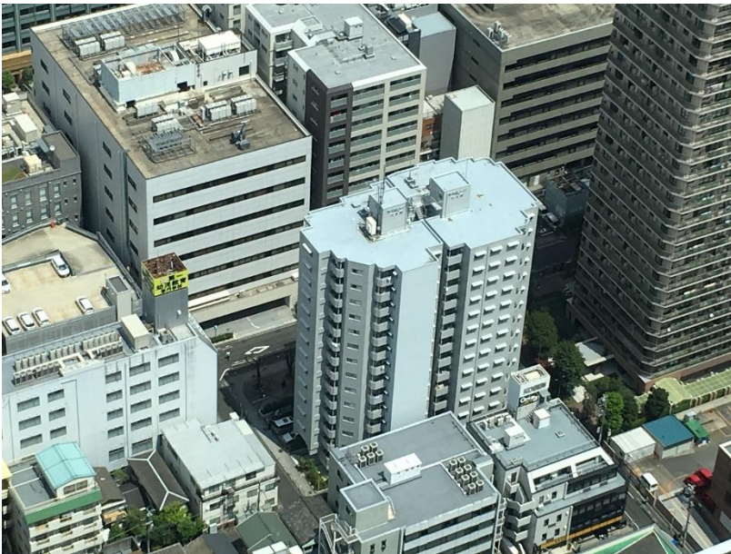
DAS ジャパン(株)本社ビル 正面の白いビルの5F 池袋サンシャインビル55F から撮影